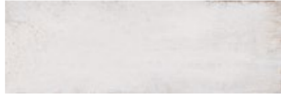
20171 MITTE-G/25x75 BN16 (25x75) 24 gráficas/patterns