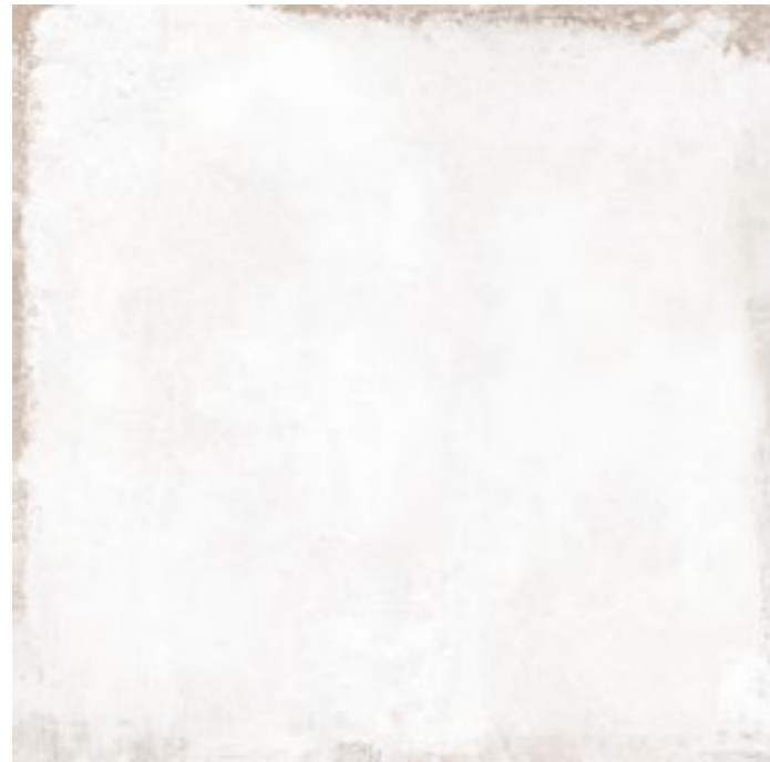
20079 MITTE-W/90,7x90,7/R BN48 (90,7x90,7) [4-1-EH]**** CLASE 1 R-9 10 gráficas/patterns