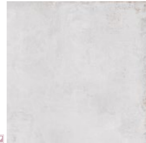
20579 MITTE-G/60,7x60,7/R BN33 (60,7x60,7) 15 gráficas/patterns