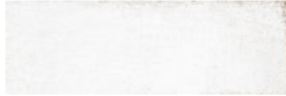
20172 MITTE-W/25x75 BN16 (25x75) 24 gráficas/patterns