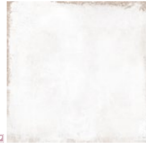
20576 MITTE-W/60,7x60,7/R BN33 (60,7x60,7) 15 gráficas/patterns