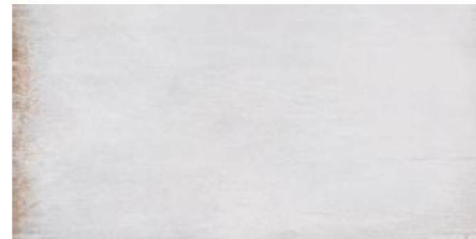
20168 MITTE-G/45x90,7/R BN70 (45x90,7) [4-1-EH]**** CLASE 1 R-9 20 gráficas/patterns