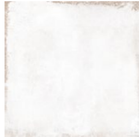
20576 MITTE-W/60,7x60,7/R BN33 (60,7x60,7) [4-1-EH]**** CLASE 1 R-9 15 gráficas/patterns