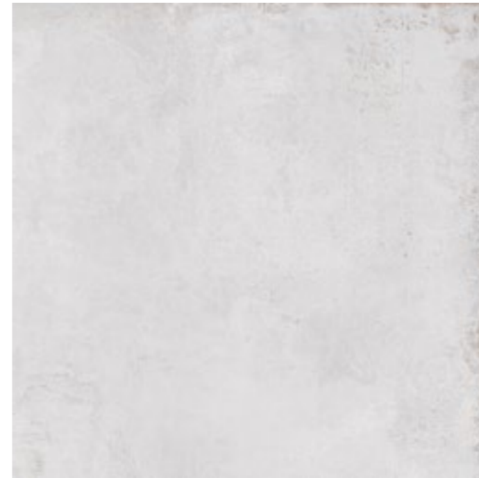
20082 MITTE-G/90,7x90,7/R BN48 (90,7x90,7) [4-1-EH]**** CLASE 1 R-9 10 gráficas/patterns