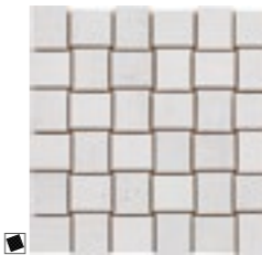
20352 D.MITTE-G P-53 (30x30)

MATCHING WALL COLLECTIONS WALL CATALOGUE 2017