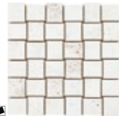
20351 D.MITTE-W P-53 (30x30)