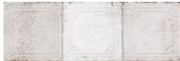
20176 WILMA BN20 (25x75) 6 gráficas/patterns