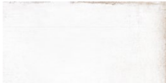
20167 MITTE-W/45x90,7/R BN70 (45x90,7) [4-1-EH]**** CLASE 1 R-9 20 gráficas/patterns