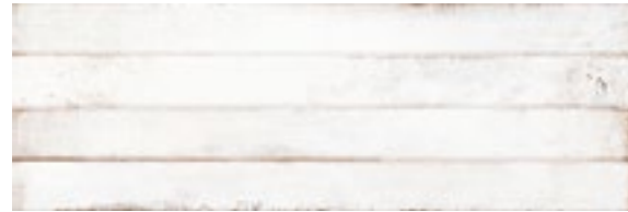
20174 ALEX-W BN20 (25x75) 6 gráficas/patterns