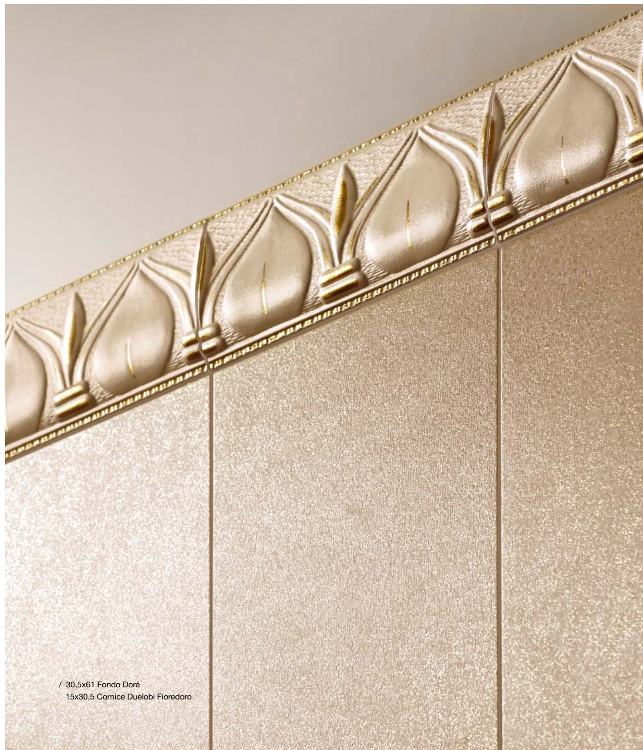
/ 30,5x61 Fondo Doré 15x30,5 Cornice Duelobi Fioredoro