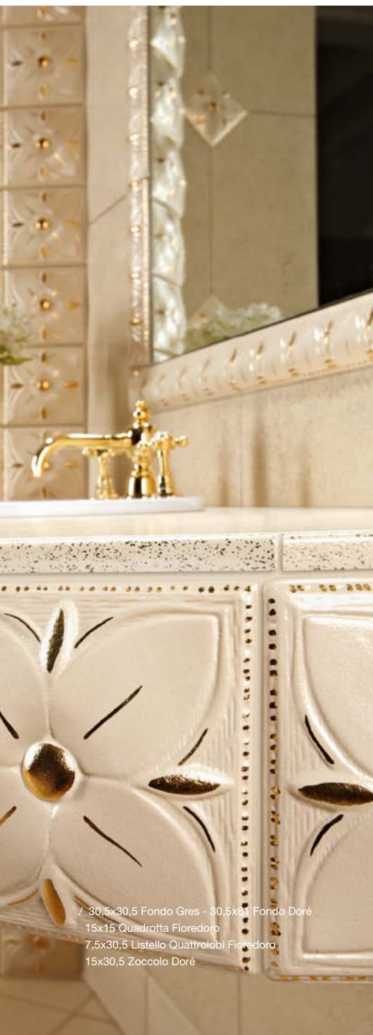
/ 30,5x30,5 Fondo Gres - 30,5x61 Fondo Doré 15x15 Quadrotta Fioredoro 7,5x30,5 Listello Quattrolobi Fioredoro 15x30,5 Zoccolo Doré