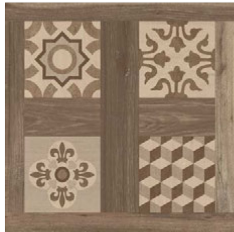
SELANDIA DECOR NOCE