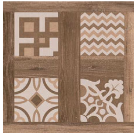
SELANDIA DECOR EBANO