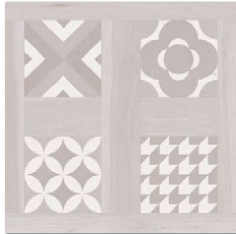
SELANDIA DECOR BIANCO