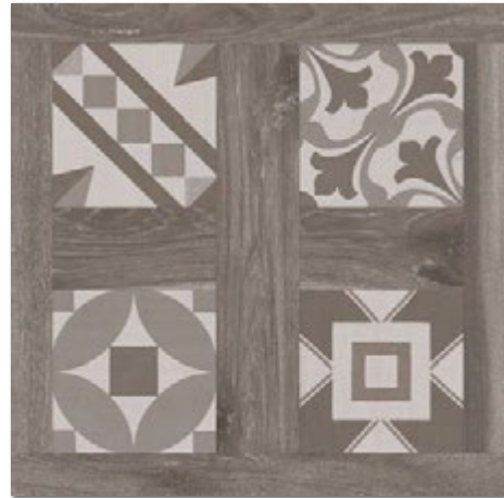
SELANDIA DECOR FUMO