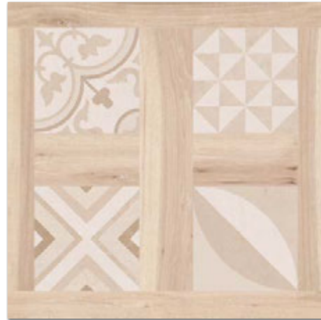
SELANDIA DECOR HAYA