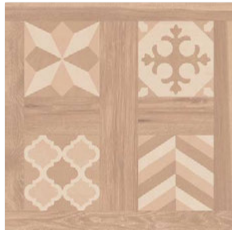
SELANDIA DECOR MIELE