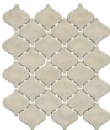
65002 Арабески котто беж 26x30 Arabesques Cotto beige

The Islamic period has rich heritage in Andalusia. This is clearly seen in the Arabic style in architecture and finishing. Typically, terra-cotta tiles were used by Mediterranean artists in geometrical mosaic ornaments known as the arabesque.