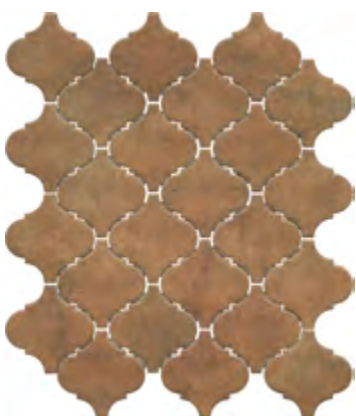
65003 Арабески котто рыжий 26x30 Arabesques Cotto ginger