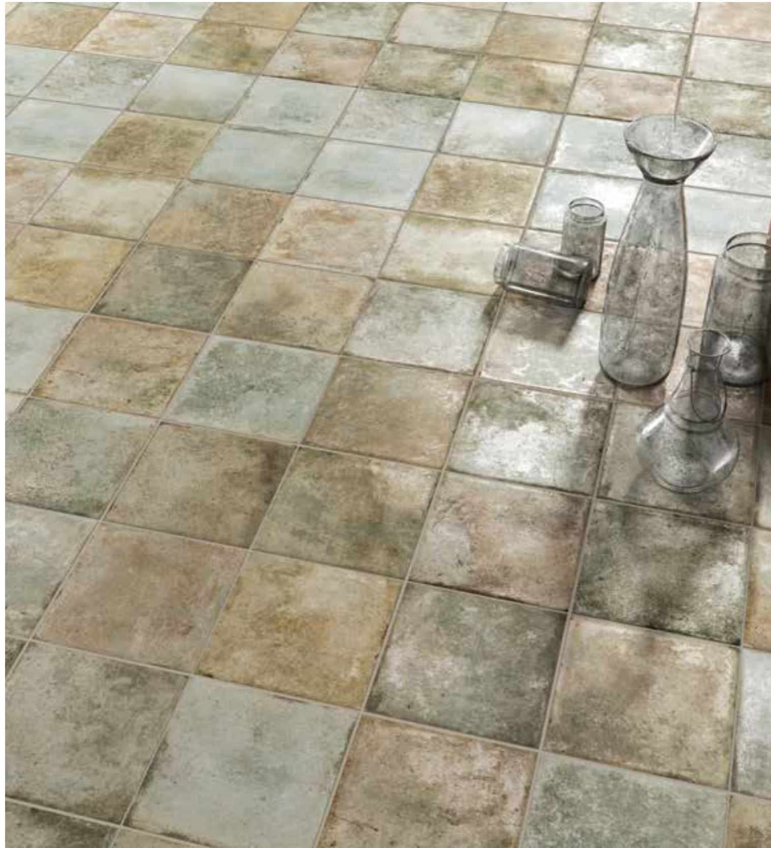
__ FS Etna Sage