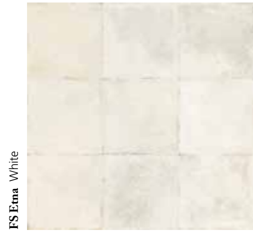
FS Etna White