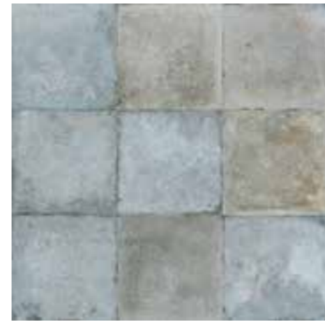
FS Etna Blue