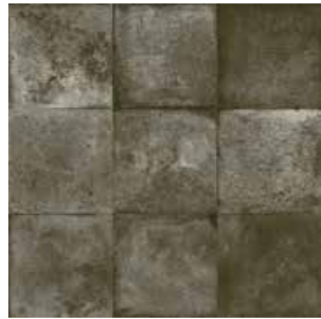
FS Etna Black