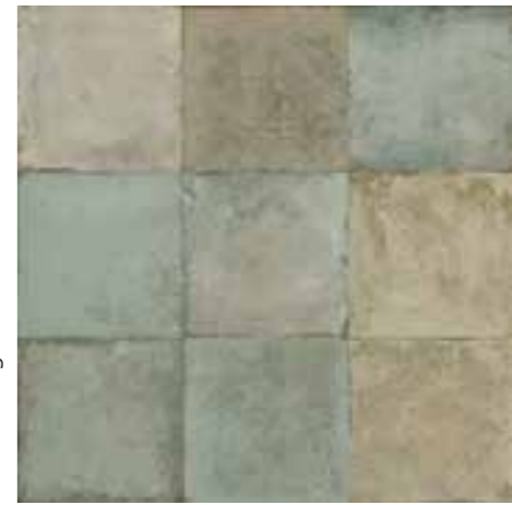
FS Etna Sage