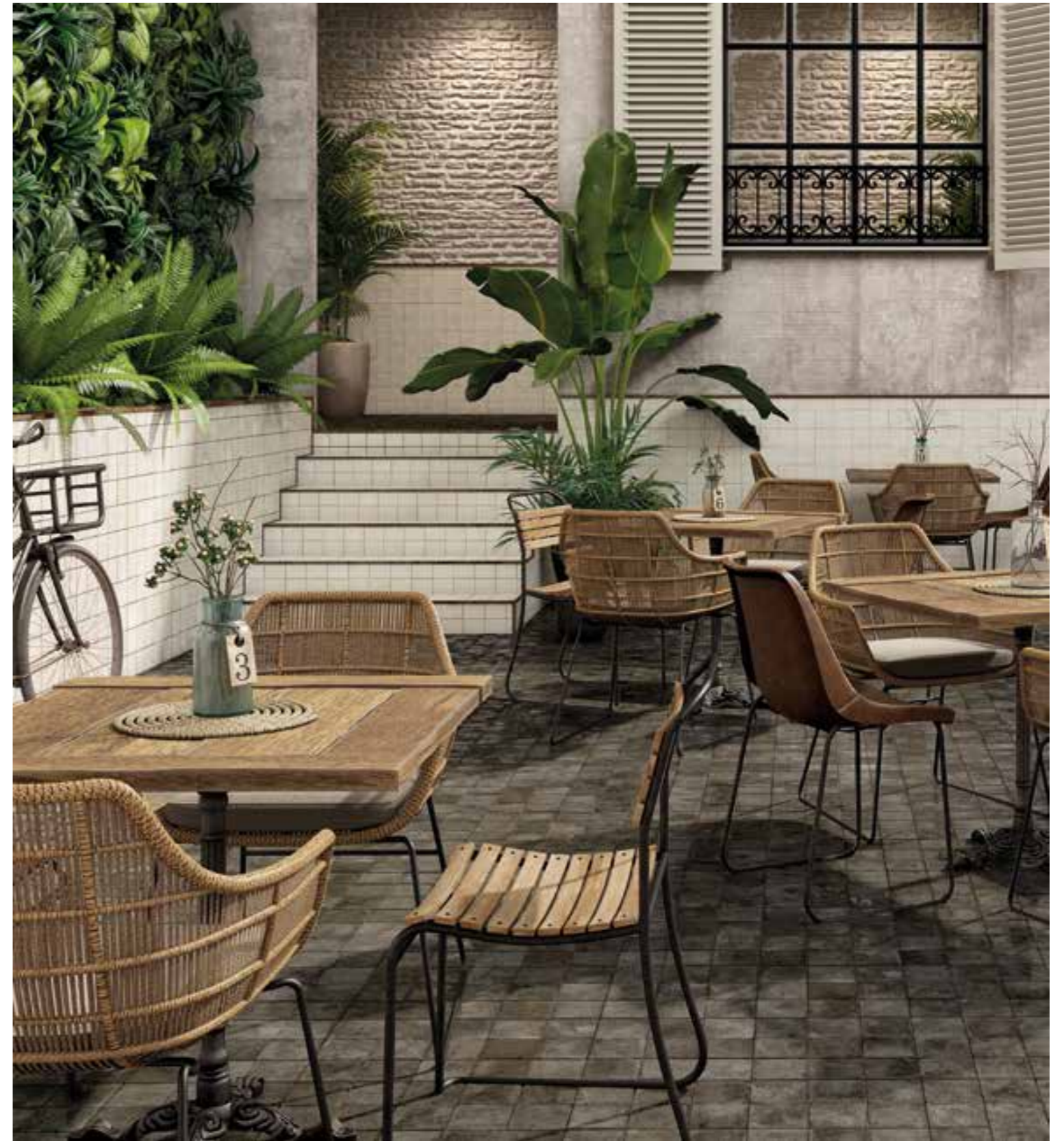
__ FS Etna White __ FS Etna Black