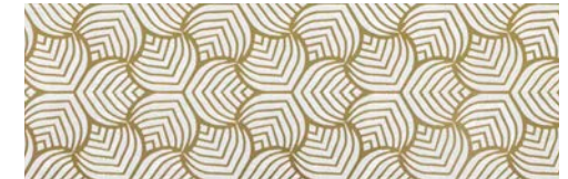
HSA655 SPIKE 30X90 DORADO · P45