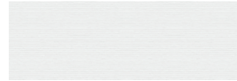
HTA500 GLAZE 30X90 BLANCO · B27