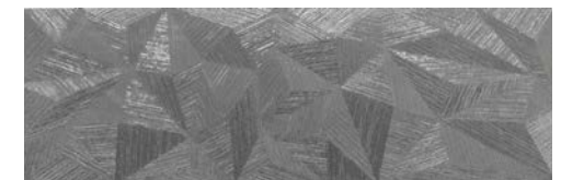
HNW480 RADIANCE 30X90 PLATA · P42