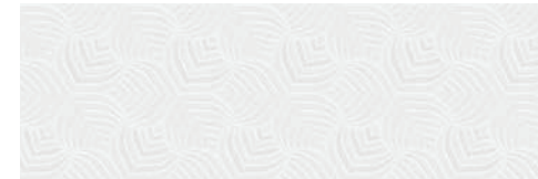
HSP500 SPIKE 30X90 BLANCO · B29