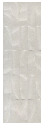
12151R Безана серый светлый структура обрезной 25x75 Besana light grey structured rectified