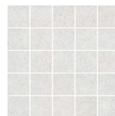
MM12136 Безана серый светлый мозаичный 25x25 Besana light grey mosaic