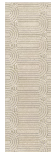
OPC201\12138R Безана бежевый обрезной 25x75 Besana beige rectified