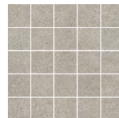
MM12137 Безана серый мозаичный 25x25 Besana grey mosaic