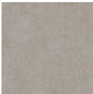
SG457600R Безана серый обрезной 50,2x50,2 Besana grey rectified