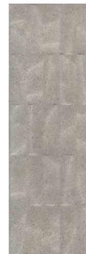
12152R Безана серый структура обрезной 25x75 Besana grey structured rectified