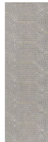
OPB201\12137R Безана серый обрезной 25x75 Besana grey rectified