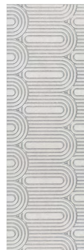
OPA201\12136R Безана серый светлый обрезной 25x75 Besana light grey rectified