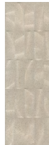
12153R Безана бежевый структура обрезной 25x75 Besana beige structured rectified