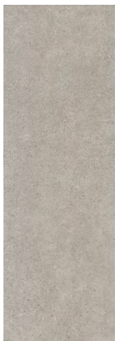
12137R Безана серый обрезной 25x75 Besana grey rectified