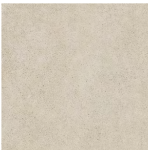
SG457500R Безана бежевый обрезной 50,2x50,2 Besana beige rectified