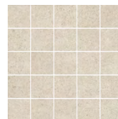
MM12138 Безана бежевый мозаичный 25x25 Besana beige mosaic