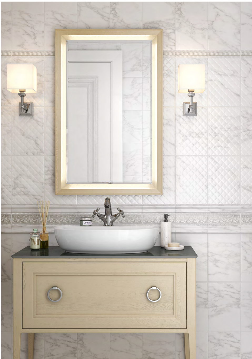
PFE019 Бре́ра жёлтый 20x2,0 Brera yellow