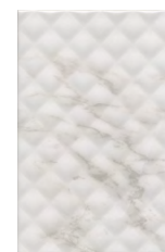
8328 Бре́ра белый структура 20x30 Brera white structured