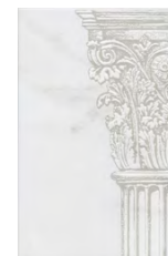
AD\A548\8327 Бре́ра 20x30 Brera