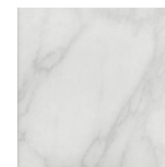
SG1596N Бре́ра белый 20x20 Brera white