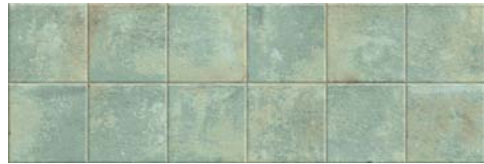
HERITAGE R90 GREEN · 30x90 cm · B44

Rejunte recomendado Manhattan. · Recommended grouting Manhattan.