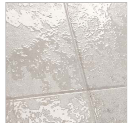
MATE · MATT