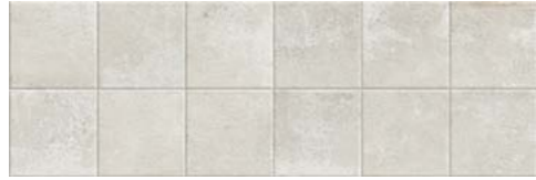
HERITAGE R90 WHITE · 30x90 cm · B44

Rejunte recomendado Manhattan. · Recommended grouting Manhattan.