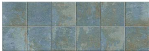
HERITAGE R90 BLUE · 30x90 cm · B44

Rejunte recomendado Caramelo. · Recommended grouting Caramelo.