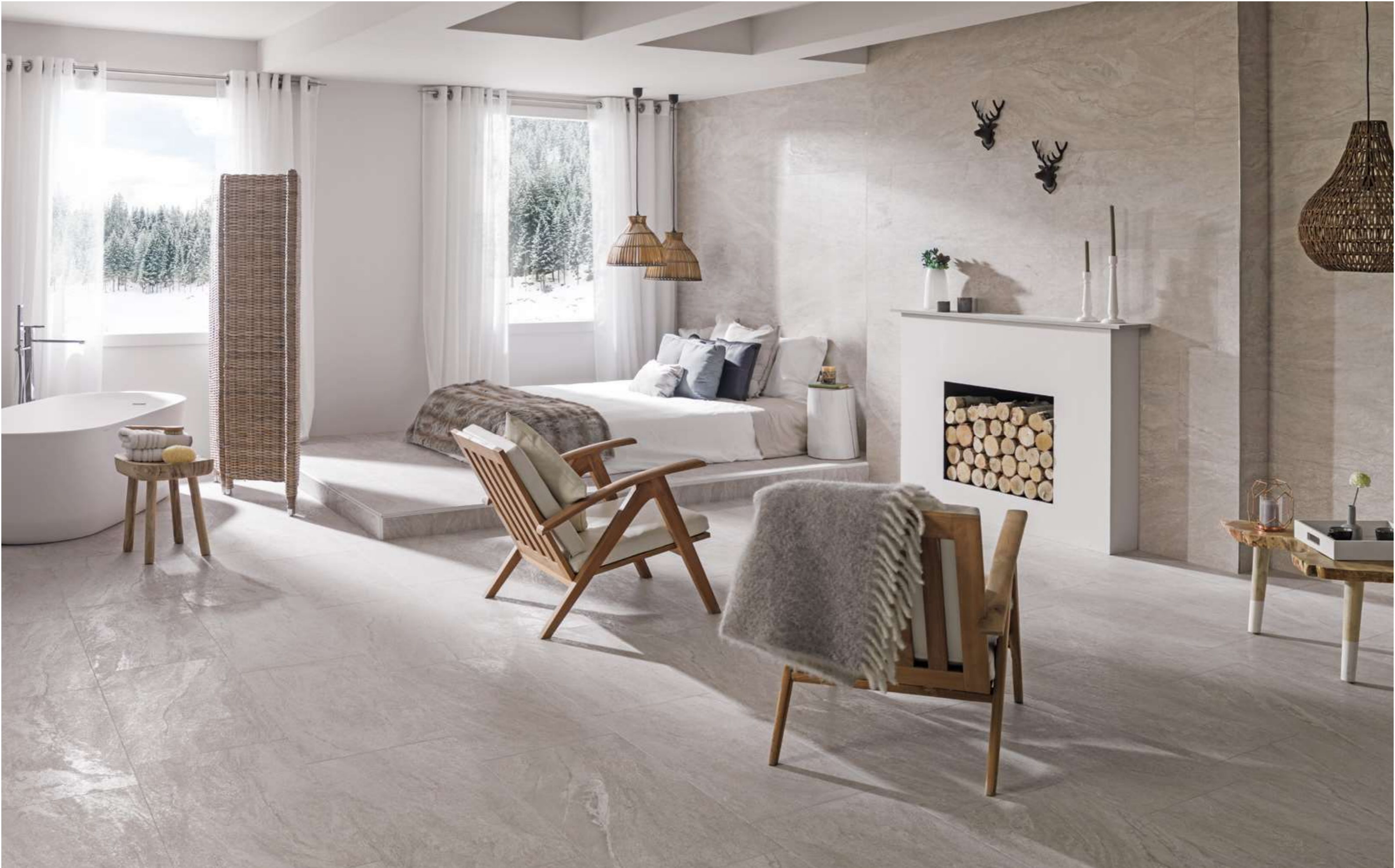
PARED WALL: Austin Natural 45x120 cm - SUELO FLOOR: Austin Natural 40x80 cm