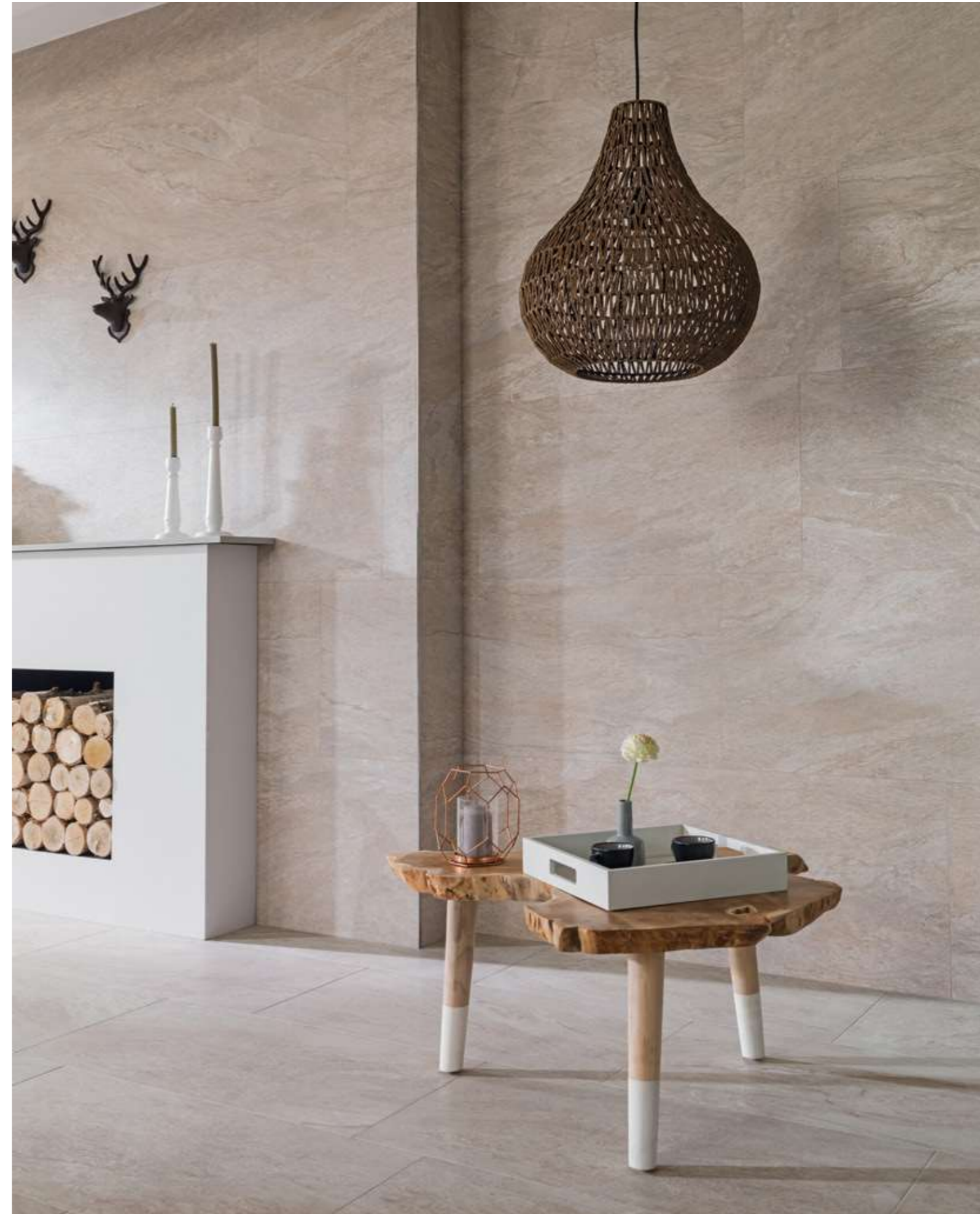
PARED WALL: Austin Natural 45x120 cm · SUELO FLOOR: Austin Natural 40x80 cm