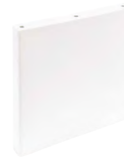
*31246 TAMIZ WHITE/20X20 H6 (20x20 cm — 77/8x77/8")