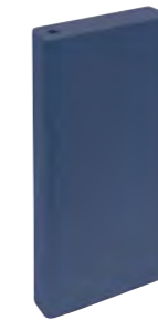
*31813 E.TAMIZ BLUE/20X20 H3 (8x20 cm — 3 1/8x77/8")