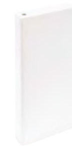
*31810 E.TAMIZ WHITE/20X20 H3 (8x20 cm — 3 1/8x77/8")