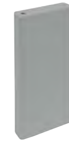
*31812 E.TAMIZ GREY/20X20 H3 (8x20 cm — 3 1/8x77/8")