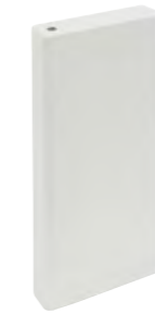
*31811 E.TAMIZ SILVER/20X20 H3 (8x20 cm — 3 1/8x77/8")