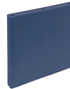
*31249 TAMIZ BLUE/20X20 H6 (20x20 cm — 77/8x77/8")