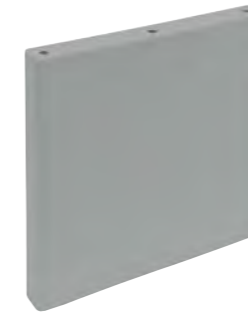
*31248 TAMIZ GREY/20X20 H6 (20x20 cm — 77/8x77/8")