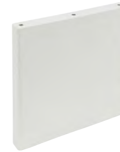
*31247 TAMIZ SILVER/20X20 H6 (20x20 cm — 77/8x77/8")