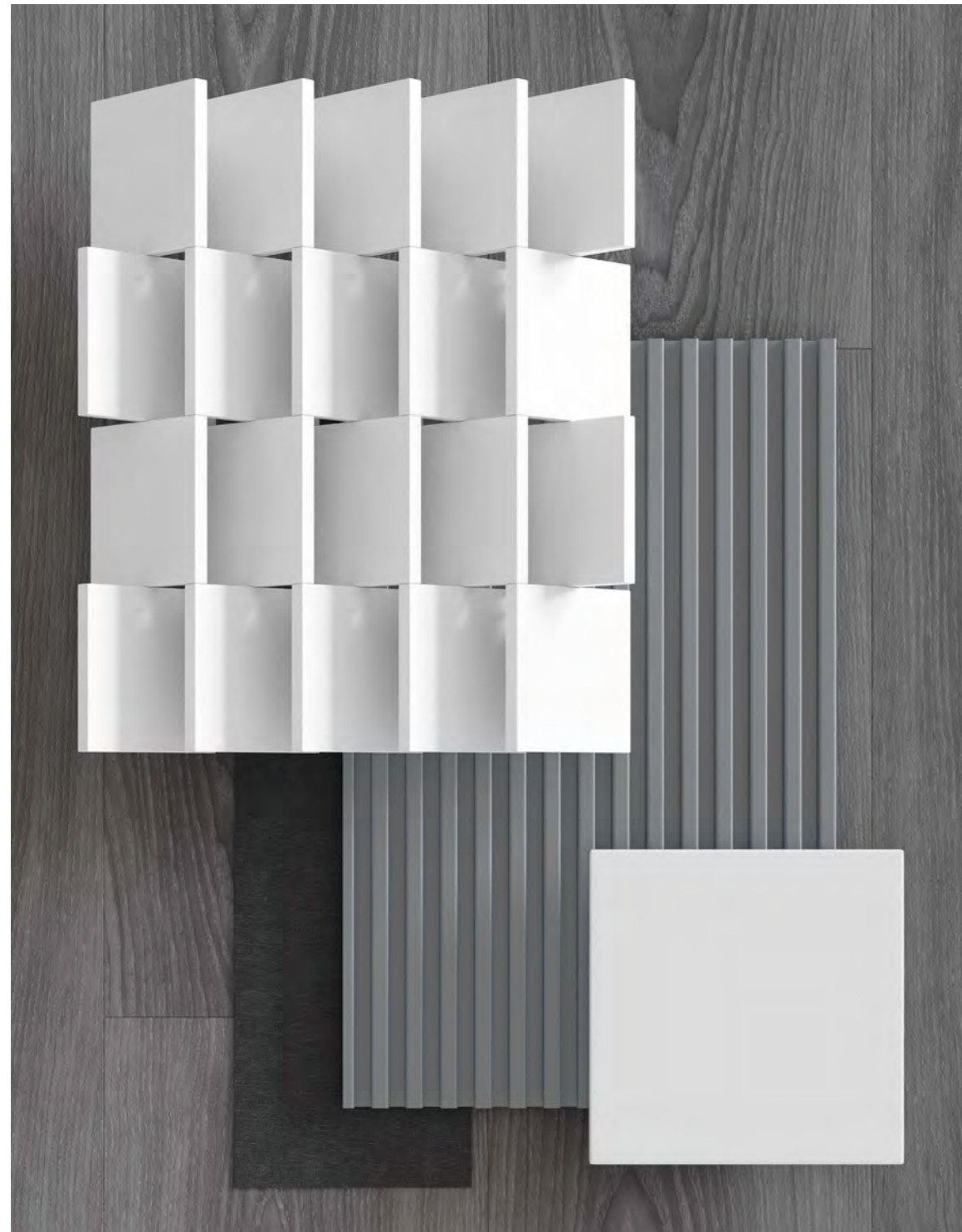
extruded stoneware 20x20