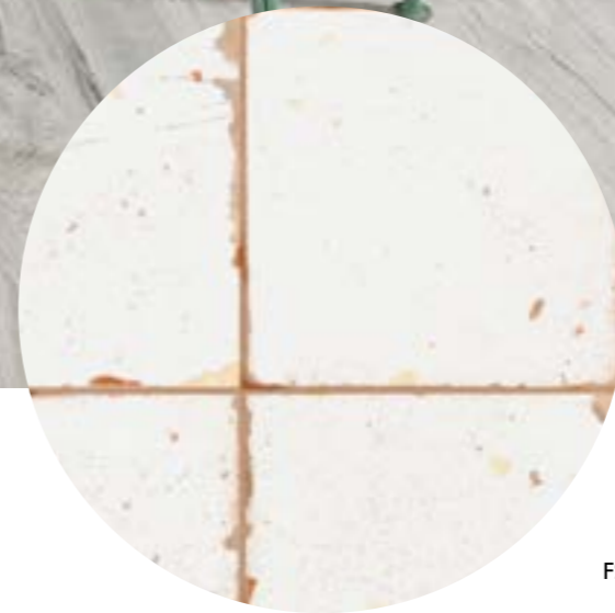
FS Artisan Decor-A FS Artisan-B Mumble-G_15*90