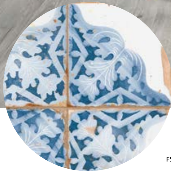
FS Artisan Decor-A