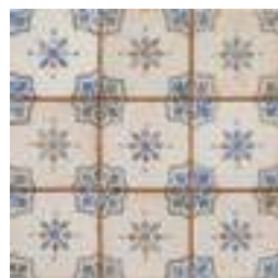
20300 FS MIRABEL-A BN14 (33x33) [5-2-H]**** CLASE 2 R-10 4 gráficas/patterns