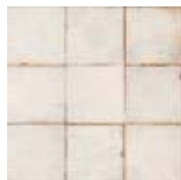
20527 FS MIRABEL-B BN14 (33x33) [5-2-H]**** CLASE 2 R-10 4 gráficas/patterns