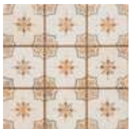
20301 FS MIRABEL-M BN14 (33x33) [5-2-H]**** CLASE 2 R-10 4 gráficas/patterns