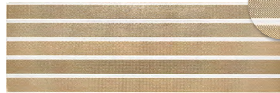
19287 D.REFLEX GOLD P-64 (25x75)