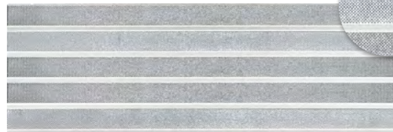
19286 D.REFLEX SILVER P-64 (25x75)