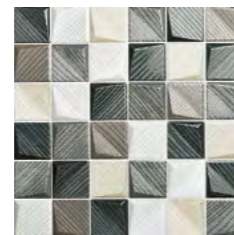
19249 D.TIMELESS P-50 (30x30)