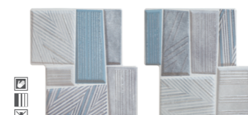
* 20337 D.TENON GREY P-50 (20x21,5)