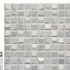
20340 D.RUSTY P-51 (30x30)