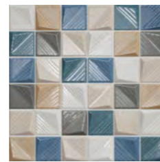
19250 D.PLAYFUL P-50 (30x30)