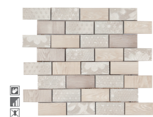
20361 D.SUBTILE P-68 (30x30)