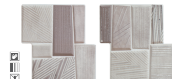
* 20338 D.TENON BROWN P-50 (20x21,5)

* Se comercializan en conjuntos de 2 piezas. Precio por pieza individual. They are sold in groups of 2 pieces. Price to the individual piece.