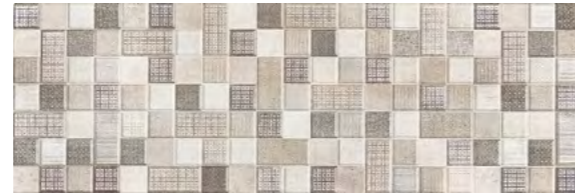
19245 D.VENICE-H P-40 (25x75)