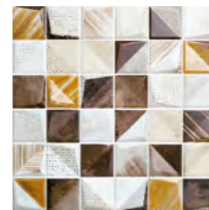
19248 D.NUKA-H P-50 (30x30)