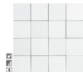
20296 D.STEPS-W P-44 (30x30)