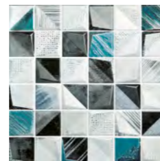
19247 D.NUKA-G P-50 (30x30)