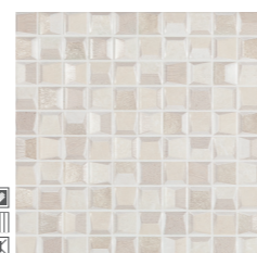
20456 D.STONY-B P-51 (30x30)