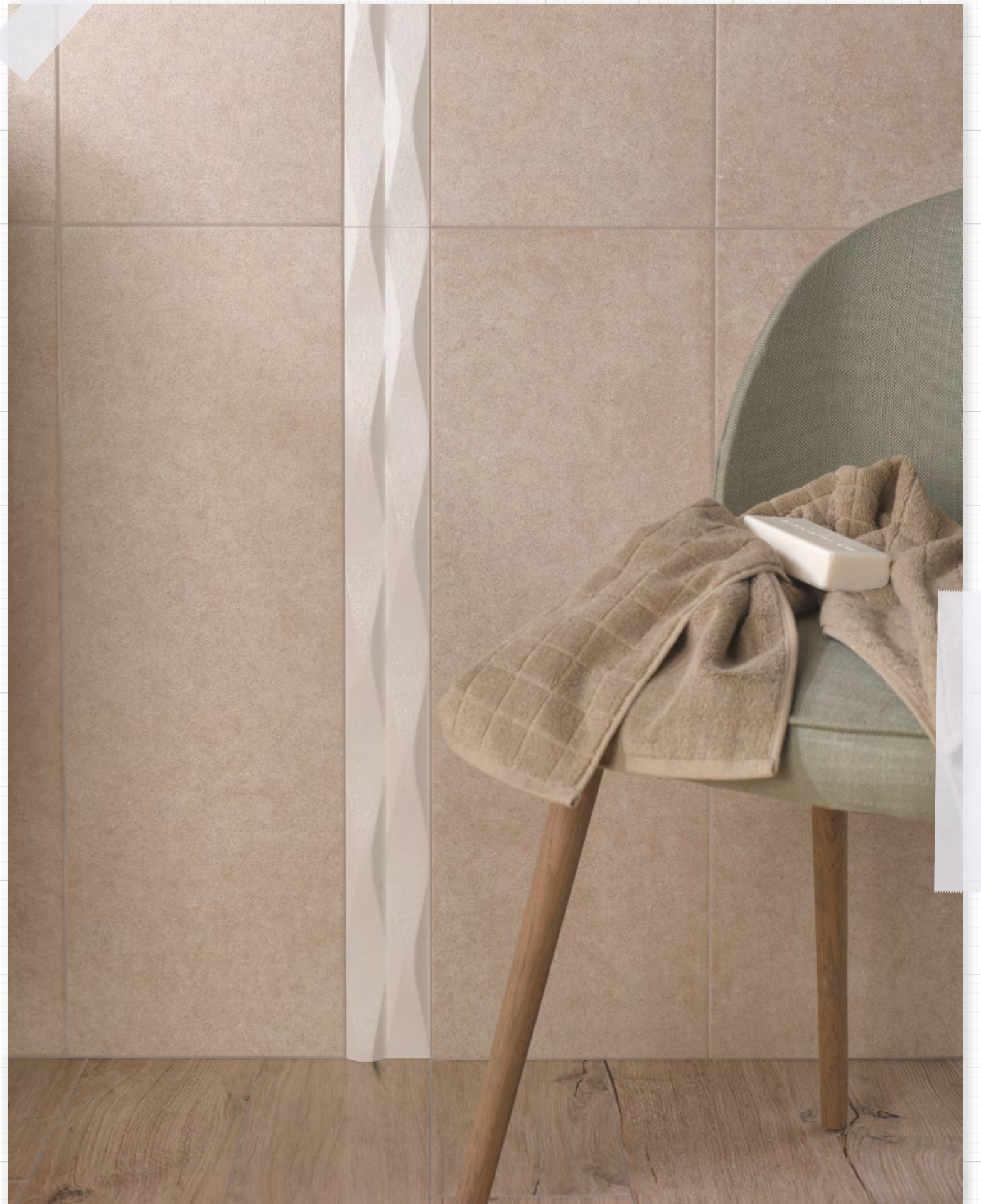
*D. Reflex Silver