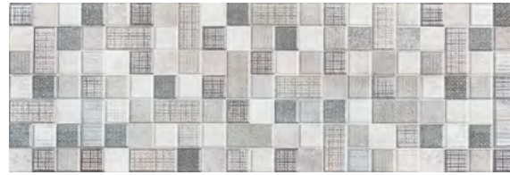
19246 D.VENICE-G P-40 (25x75)