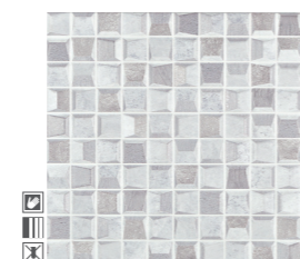
20341 D.STONY-G P-51 (30x30)