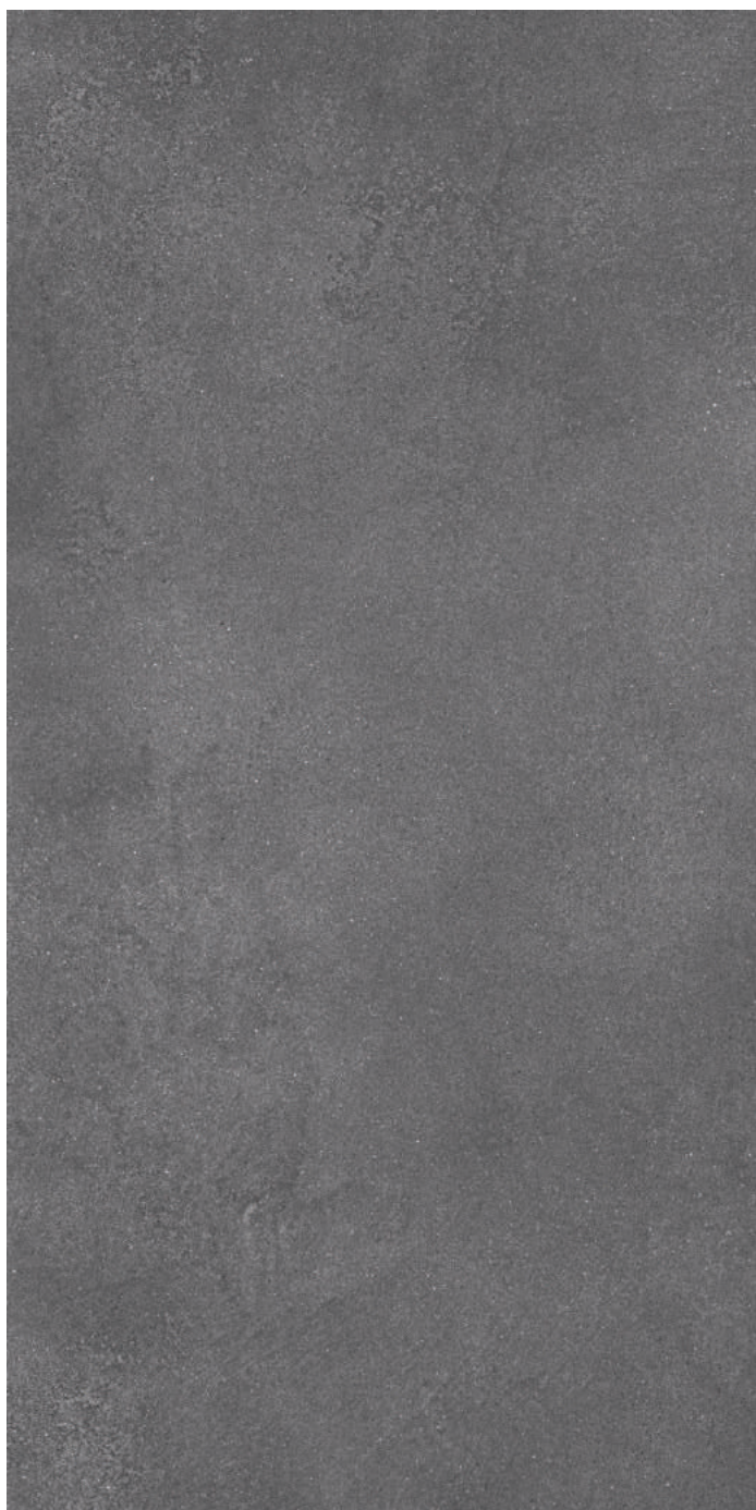
DL571200R Турнель серый тёмный обрезной 80x160 Tournelle dark grey rectified