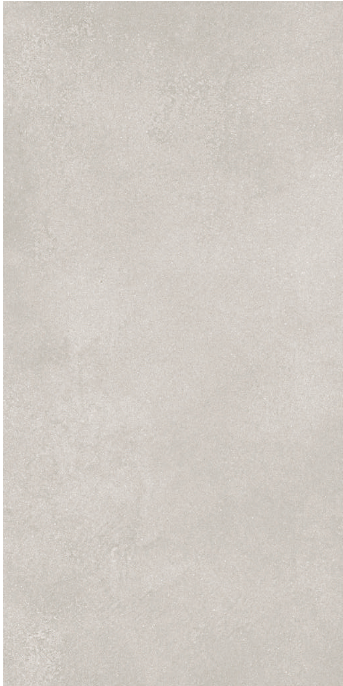
DL571100R Турнель серый светлый обрезной 80x160 Tournelle light grey rectified