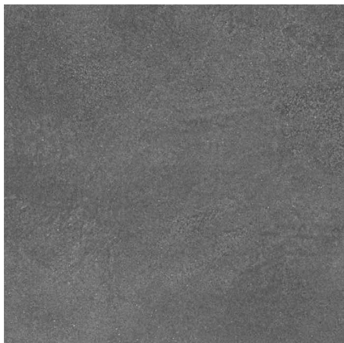
DL840900R Турнель серый тёмный обрезной 80x80 Tournelle dark grey rectified