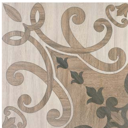
SG450800N Якаранда 50,2x50,2 Jacaranda