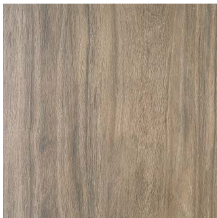
SG450600N Якаранда коричневый 50,2x50,2 Jacaranda brown