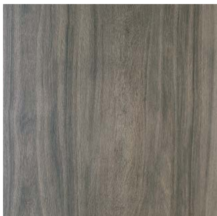
SG450700N Якаранда чёрный 50,2x50,2 Jacaranda black