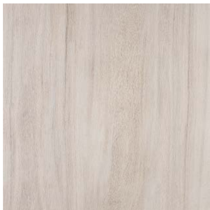
SG450500N Якаранда беж 50,2x50,2 Jacaranda beige