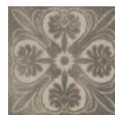
HGD/A11/TU0031L Себето лаппатированный 15x15x0,9 Sebeto lappato