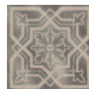
HGD/A12/TU0031L Себето лаппатированный 15x15x0,9 Sebeto lappato