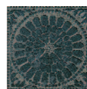
STG/A145/TU2096 Гималаи 14,5x14,5 Himalayas