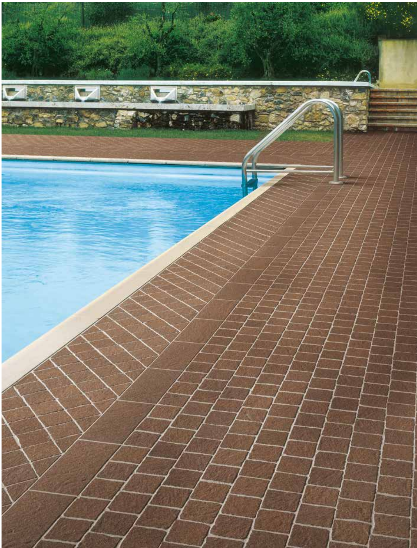
Slab/15 Rosso, Tozz. Porphir Rosso