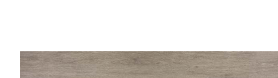
KREA ÁLAMO ASH 19,5x120