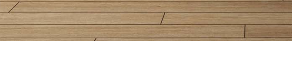
KREA SÁNDALO ENEA 19,5x120