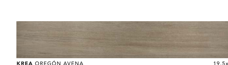
KREA OREGÓN AVENA 19,5x120