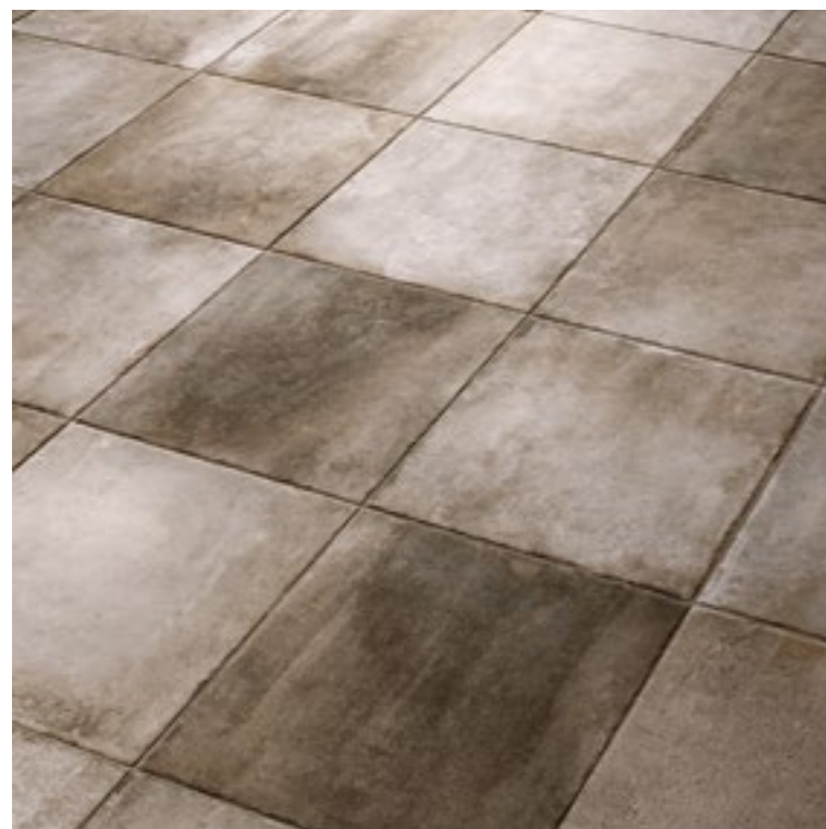
Native Grey 6161