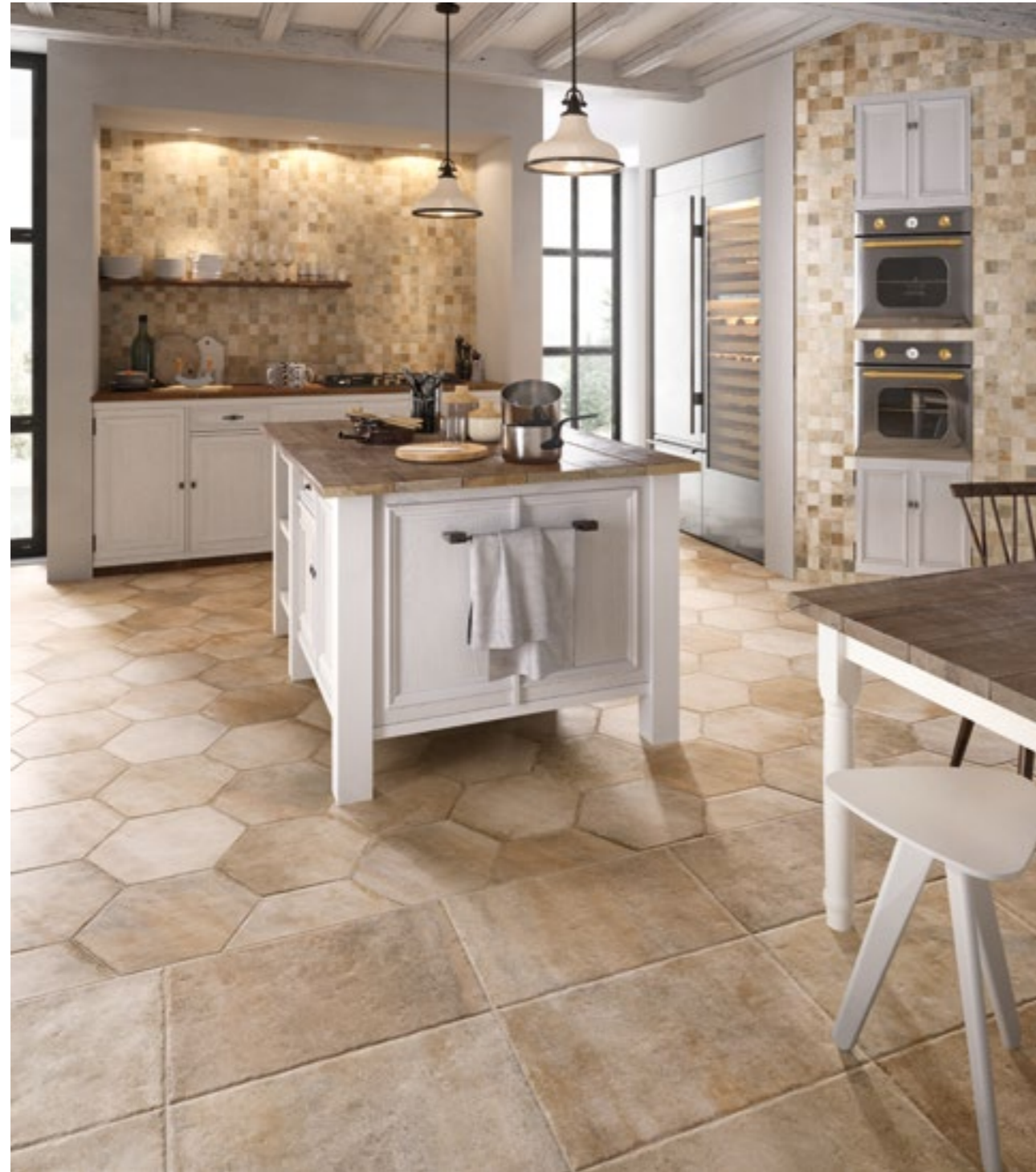
Native Beige Mosaico Native Beige 4161, Native Beige Esagono