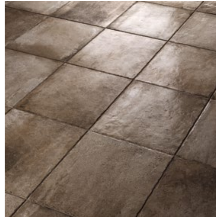
Native Dark 6161 Antique