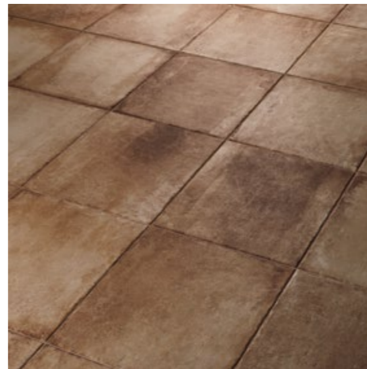
Native Fire 6161