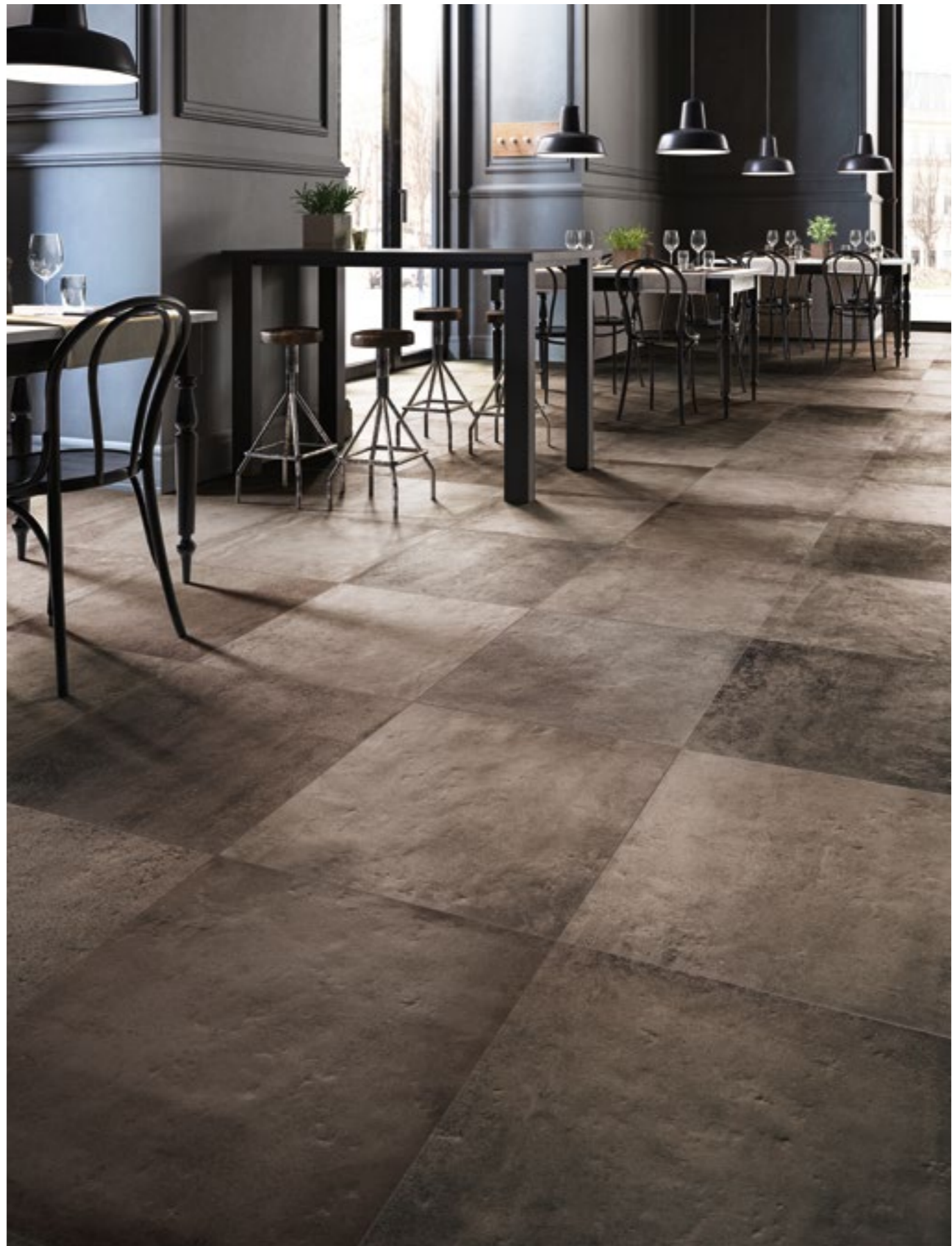
Native Dark 6060