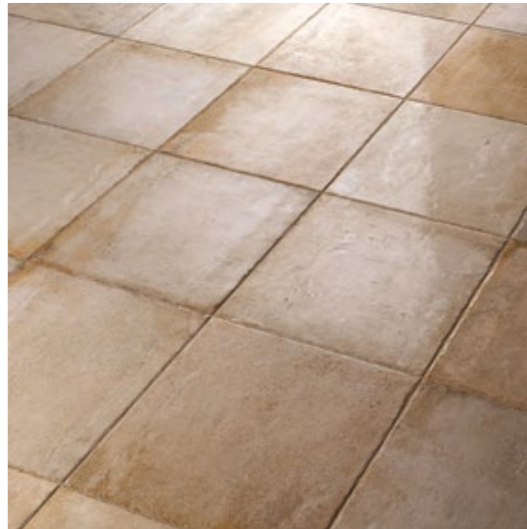
Native Beige 6161 Antique