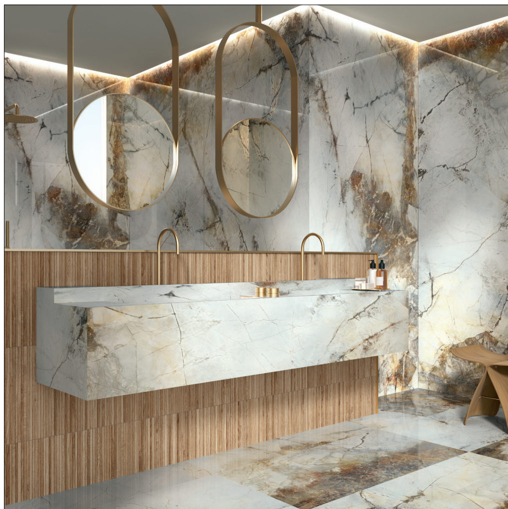
GOLD HARD POL RECT. 60X120 / KI CARAMELLO RECT. 40X120