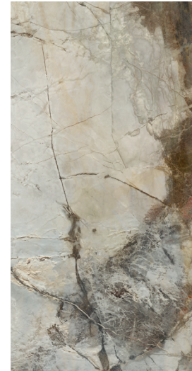
GOLD HARD POL RECT. 60X120 / 24"X48" J89/M